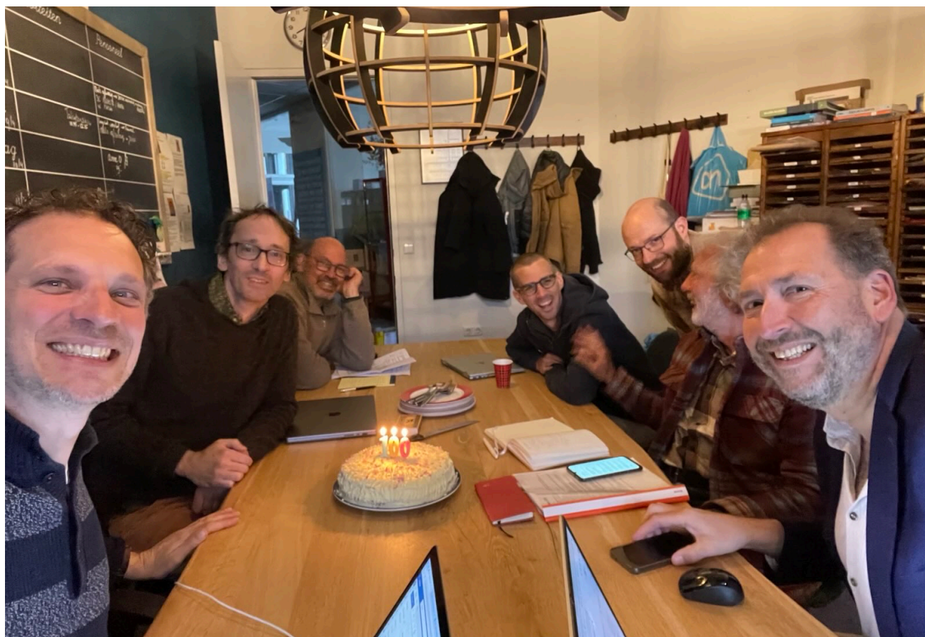
de maandelijkse vergadering van de kopgroep van Duurzaam Slotervaart