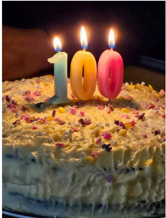
In april verwelkomden we ons 100ste lid.