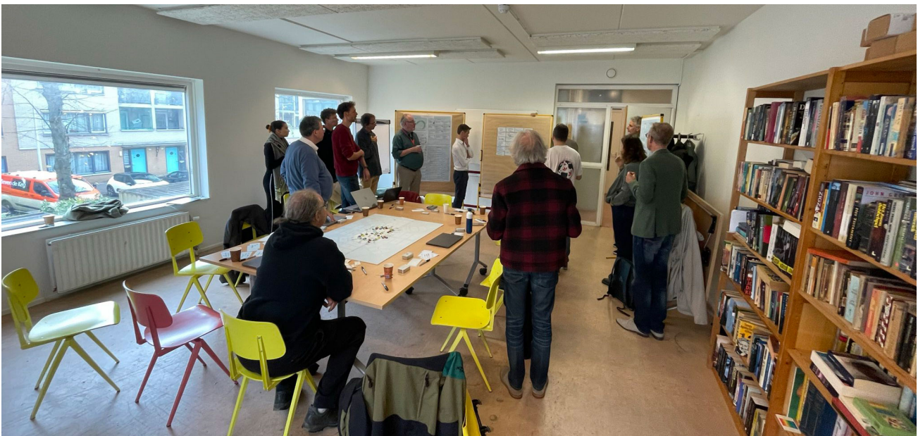
Bijeenkomst van de stakeholders. Onder leiding van bureau Greenchange wordt gewerkt aan het plannen van het ingewikkelde proces om een warmtenet van de grond (of in de grond) te krijgen.

Het betreft de gemeente, het waterschap als beheerder van de Sloterplas, woningbouwcorporaties, Sanquin (bloedbank) als mogelijke warmtebron, vastgoedbeleggers met eigendom zoals de scholen, de woningen rond het Sierplein en de zorginstelling De Schutse, de vereniging huiseigenaren Slotervaart VHS, het platform voor energie gemeenschappen in Nieuw West 'Westerlicht', Buurtwarmte (landelijke expertise op warmtenetten en begeleiding van ons initiatief in opdracht van de gemeente), Vattenfall als mogelijke leverancier van een warmtebedrijf en Liander. Een specifiek traject is nu bezig om de stakeholders te betrekken bij de haalbaarheidsstudie waar we een aantal dagen onder leiding van een professioneel bureau (Greenchange) aan een gezamenlijke opdracht hebben gewerkt. Het komende half jaar werken we met betrokkenheid van de stakeholders en een groep betrokken bureaus aan de studie.