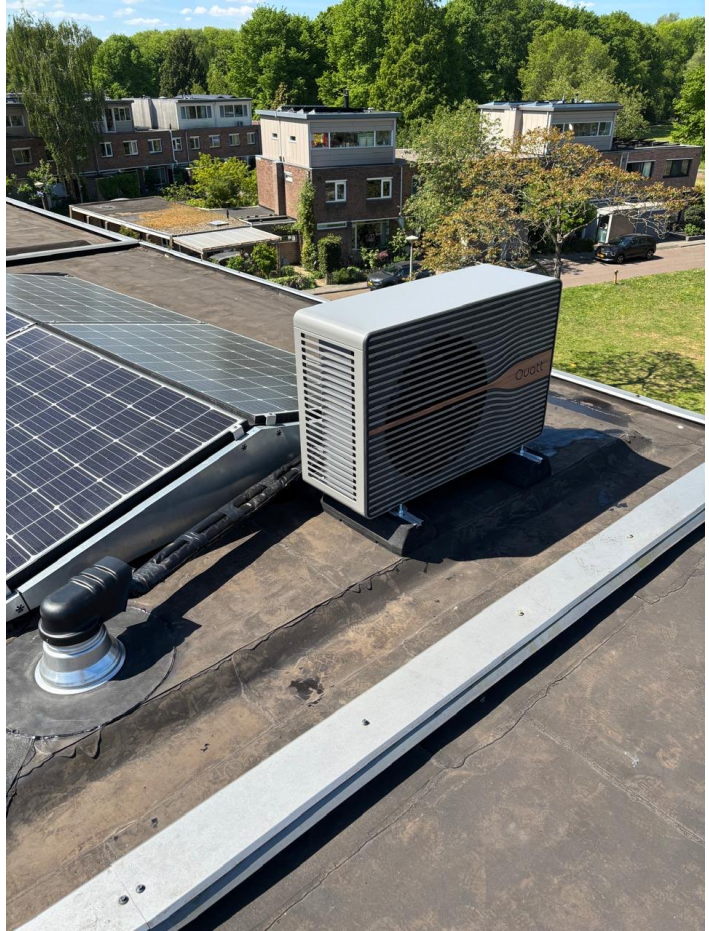
Een warmtepomp van Quatt - voordelig aangeschaft door gezamenlijk inkoopvoordeel.